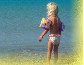
Site entièrement rénové entre 2001 et 2006